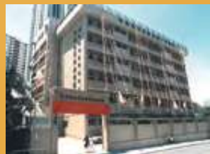
開辦首間政府資助院舍——佛教沈馬瑞英護理安老院