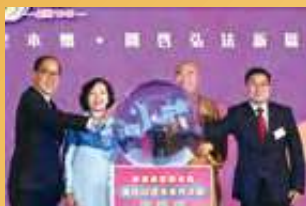
邁向80週年，11月開展80週年一系列慶祝活動。