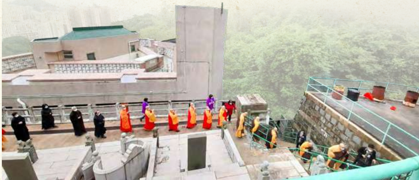
香港佛教墳場「夢影花徑」於2022年12月16日啟用

今年為佛聯會80週年的新里程，除了堅守服務大眾的使命，同時繼往開來，正籌建新的服務總部，新總部將設有佛堂、禮堂、醫療、輔導、辦公室、會議室和社會服務的空間，這象徵着佛聯會對未來更深遠的承擔。這不僅是一所新服務總部，更是一個時代的承諾，讓慈悲伸得更廣，讓佛法照得更遠，讓香港這座城市，因佛聯會的存在，而更加安定、溫暖、祥和。■