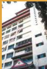
香港佛教聯合會文化中心落成