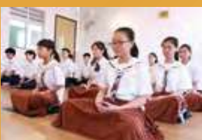
回應社會需要，於會屬中學推行「覺醒禪修：提升身心靈健康」計劃。