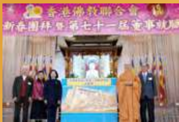
宣佈籌建新服務總部，以開設更多服務，呼籲大眾共同捐款成就佛教善業。