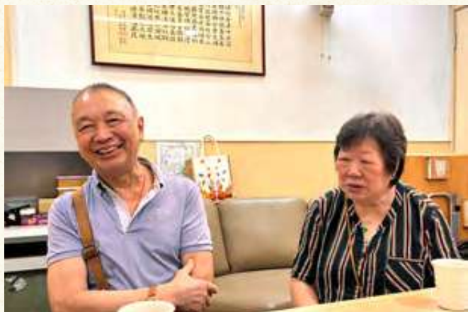
余伯伯與太太是佛教張妙願長者鄰舍中心的「忠粉」，做了20年會員，他們讚許中心職員和社工的窩心，主動幫忙大小事。

在中心的日子，兩人也享受無數快樂時光。余太最愛參加手作課堂：迷你茶檔、針織杯墊、捲紙畫、刺繡公仔，每次完成都有滿滿的成功感。余伯伯笑說：「我陪老婆來的，『傻更更』坐着等她。」雖然語氣輕鬆，但他對中心一樣讚不絕口，就是活動多姿多彩，運動、遊戲、健康講座樣樣都有，他倆衷心感謝佛聯會真心真意為長者服務，長者晚年也能享有豐盛生活。