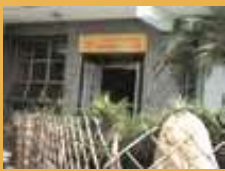
先後開辦4間長者中心，即現時的佛教傅黃合長者鄰舍中心、佛教正行長者鄰舍中心、佛教張妙願長者鄰舍中心和佛教何潘月屏長者文化中心。