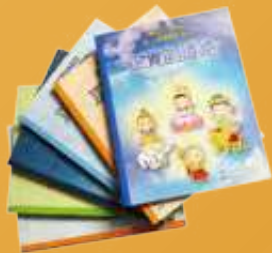
改革佛學課程，在會屬學校開辦「佛化德育及價值教育科」。