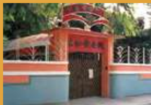
開辦首間自負盈虧安老院——慈和安老院