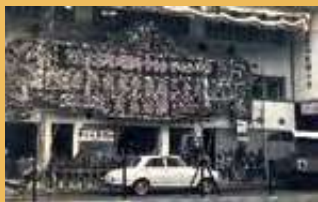
佛聯會自置新會所（即現時灣仔駱克道338號會址）