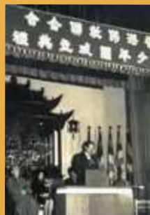
成立佛教青少年團