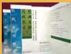
開展佛教身心靈關顧服務，並向醫院派駐「善士」及義工。