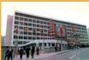
香港佛教醫院投入服務，籌建歷時逾十年。