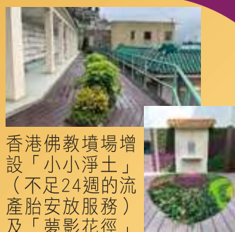
香港佛教墳場增設「小小淨土」（不足24週的流產胎安放服務）及「夢影花徑」（撒灰服務）