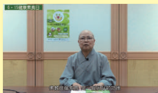
▲ 演慈法師開示素食護生意義