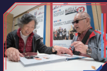
▲長者翻看學生製作的「愛情紀念冊」婚紗相，笑逐顏開。