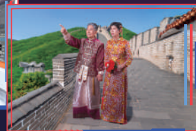
▲學生為翁氏夫婦拍攝婚紗裙褂照，利用人工智能技術將背景轉為長者希望合成的地方。