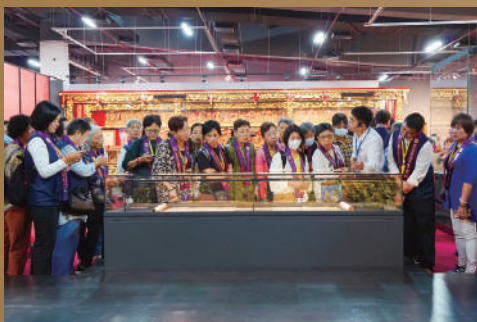
▲交流團於南華禪寺參觀「千五春秋·百代傳承」歷史文化展