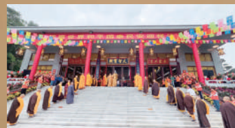
▲國恩寺舉辦的「祈願世界和平國泰民安迎祥法會」

11月3日上午，粵港澳高僧大德參與國恩寺舉辦的「祈願世界和平國泰民安迎祥法會」。主法法師包括：中國佛教協會副會長明生法師、靜波法師、賽赤·確吉洛智嘉措、五臺山佛教協會會長昌善法師、廣東省佛教協會常務副會長宏滿法師、如禪法師、禪宗四祖寺方丈明基法師、澳門佛教總會副會長寬靜法師、廣東省佛教協會副會長光秀法師，以及廣東省佛教協會副監事長印覺法師，共同祈願世界和平、國泰民安、人民幸福。