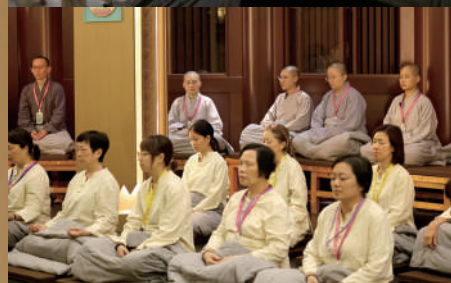
▲500名參禪者共同參與禪修