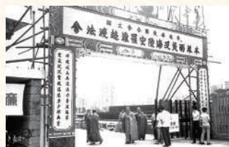
▲1972年7月13日至14日一晝兩夜的「本港雨災及海陸空罹難超渡法會」，由香港賽馬會借出跑馬地馬場舉行。