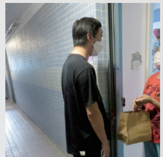
▲佛教正行長者鄰舍中心的社工會定期探訪隱蔽長者，並親自送出支援物資。