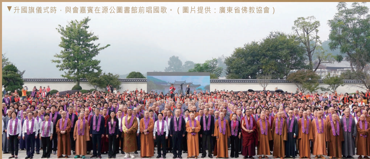
▼升國旗儀式時，與會嘉賓在源公圖書館前唱國歌。