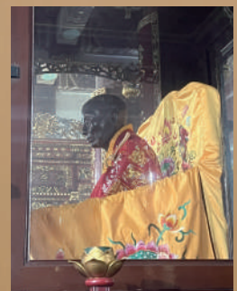
▲交流團於六祖殿瞻仰「六祖真身」