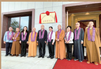
▲與會領導和高僧大德攝於揭牌後的雲門禪宗文化研究院門前