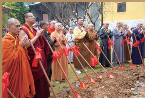
▲與會高僧大德開展「祖庭香林」植樹活動