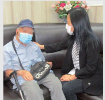
▲佛教傅黃合長者鄰舍中心的社工鼓勵長者來到中心，主動和社工傾談生活事。

如發現長者長期封閉自己，斷絕和朋友交往，可向其住所附近的社區長者中心尋求支援。香港佛教聯合會於灣仔、慈雲山、葵涌亦設有長者鄰舍中心，為長者提供專業的輔導和支援服務。當社工接到個案後，會透過探訪或電話慰問，了解長者的情況而進行評估。若有需要介入，社工會因應長者的生活、身心健康的需求，為他們提供相應的幫助；從而改善他們的生活質素、強化社交網絡，以及讓他們認識支援渠道。☎