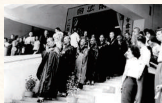
▲1963年5月26日於跑馬地馬場舉行的「香港佛教同人祈雨法會」，眾人同心祈求降雨解旱災。