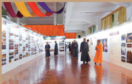
▲雲門山大覺禪寺建寺1100周年慶典乃中國佛教界大事，藉此因緣而舉辦圖片展。