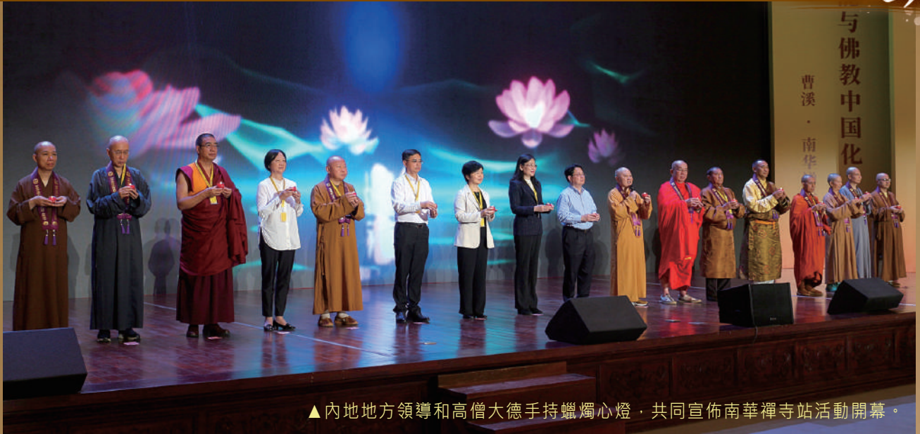
▲內地地方領導和高僧大德手持蠟燭心燈，共同宣佈南華禪寺站活動開幕。