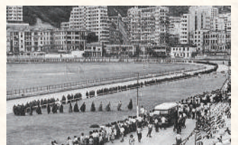
▲1960年的「香港馬場超薦法會」，1月18日下午五時開壇至21日晚圓滿，一連作法三四夜，場內設七個法壇。