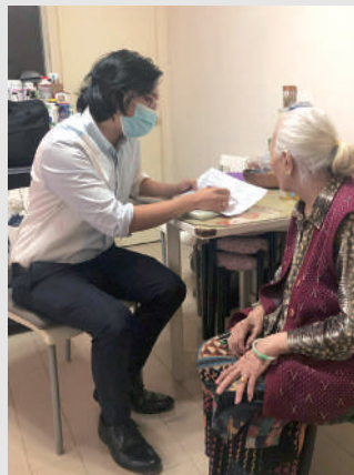
▲佛教張妙願長者鄰舍中心的社工上門為長者介紹區內的支援網絡。