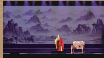
▲《南國菩提》是廣東香山粵劇團於2013年、六祖惠能圓寂一千三百周年時所創作之大型粵劇作品。

廣東省佛教協會常務副會長、國恩寺方丈如禪法師指出，六祖惠能生於雲浮新興，黃梅求法、東山密授、光孝剃髮、南華卓錫、新興圓寂。他的一生正好圓滿地在自己的故鄉，畫出了一個大「圓」。他創立的禪宗文化，成就佛教中國化。本會秘書長演慈法師致辭時感謝大會精心安排，同時感謝《南國菩提》製作及演出單位發慈悲心，將六祖惠能的故事搬上舞台，與大眾廣結佛緣。