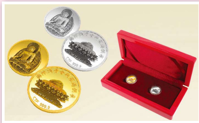
▲限量版「佛陀頂骨舍利蒞港供奉」紀念套幣

為配合今次佛頂骨舍利蒞港，本會特別精製——「佛陀頂骨舍利蒞港供奉」紀念套幣和吉祥舍利足金吊墜，供善信請購，數量有限，售完即止。另一方面又於會場內設置攤位義賣，作為隨緣樂助的布施平台，提供一個廣植福田的機會，讓十方善信在頂禮佛骨之餘，能履行佛道，積聚資糧。以下簡要介紹精品，種類繁多，不能盡錄：