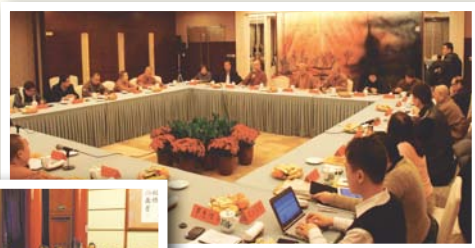
▲本會代表團與南京宗教局代表進行會議