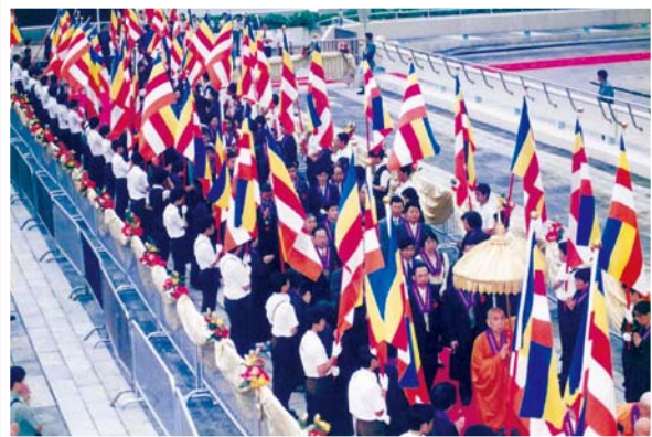
▲香港佛教聯合會於1999年舉辦迎請佛牙舍利瞻禮大會時的盛況。

尤其是佛頂骨舍利，自2010年在中國南京大報恩寺遺址盛世重光後，乃首次赴境外供奉瞻禮，作為主辦城市的香港，有幸在佛光照耀下，讓廣大善信瞻禮靈骨，猶見佛陀真身，蒙受佛恩，感應佛法，千載機緣，不容錯過。