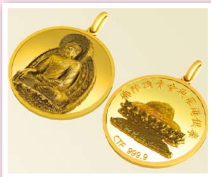
▲限量版吉祥舍利足金吊墜