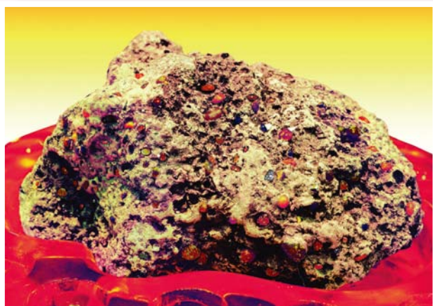
▲在高像素的攝影機拍攝下，佛頂骨的表面，呈蜂巢般孔洞，孔內顯露大大小小、五彩綢燦的舍利子，教人讚嘆。