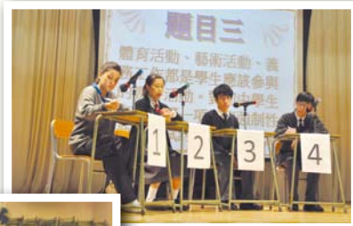
▲同學們分組進行比賽，認真參與。