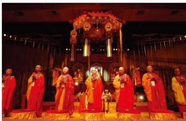
▲2004年，香港佛教界包括覺光長老、永惺長老等高僧大德，為迎請佛指舍利瞻禮大會主持儀式，氣氛莊嚴神聖。

適逢今年香港回歸祖國15週年，佛頂骨舍利首次獲准蒞港供奉，在佛光普照和佛力加被下，即使面對種種之困阻和挑戰，定必能夠一一化解，為這塊福地增添安定與祥和。☸