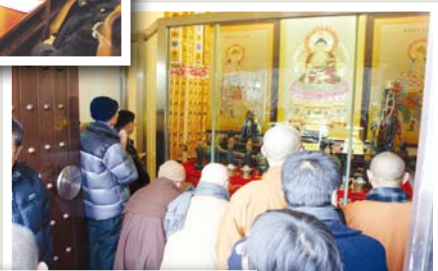
▲本會代表團參拜佛頂骨舍利