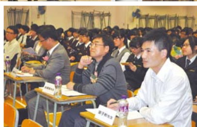
◀台下評判及觀眾投入觀賽