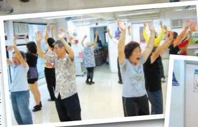
▲長者們大笑著做伸展運動