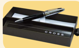
尊貴名筆一枝 (價值$250)