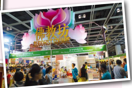
▶7月——今年書展的「佛教坊」吸引不少海內外讀者到來