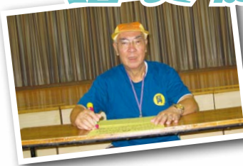
▲宣誓簽署成為「香港得得得」運動十式操推廣大使

「運動十式操」由詠春大師葉準師傅以「快樂」、「健康」、「事業」、「學業」、「親情」等為主題設計動作和口訣，義工隊更將這套動作及口訣編成「秘笈」傳授各長者。長者們一同跟隨口訣，學習長者十式操。長者們在義工及教練親切