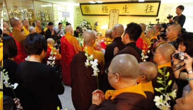
▲法師、罹難者家屬及各界代表獻花