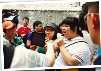
▶ 根與魂中國非物質文化遺產展演研討會

有關課程以全校參與的跨科組協作模式進行，宗旨是探討長洲區非物質文化遺產傳承的文化意義和人文精神，增加學生對長洲社區的歸屬感，並增強學生對文化遺產的認識、反思和認同，從而提高學生的批判性思考能力。此外，該課程更會引導學生認識周邊及鄰區地區的非物質文化遺產，透過跨區及跨境的考察，拓闊學生的視野，並從中審視自身對所屬社區文化空間的角色。最後，該校會總結推行相關課程的經驗，向其他地區的學校推廣，甚至在國