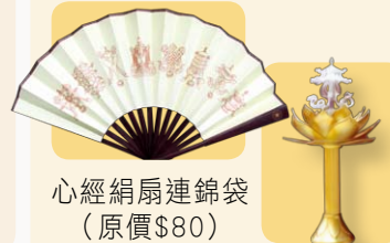
心經絹扇連錦袋 (原價$80)