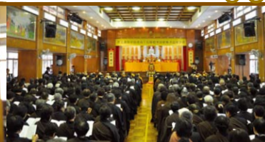
▲香港佛教聯合會會長覺光長老向大眾開示本法會的意義