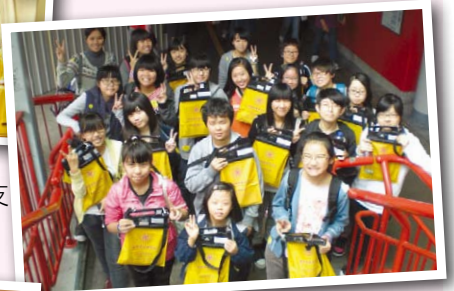
▶3月——新界區賣旗籌款，收益用作支持本會安老、青少年及幼兒服務。