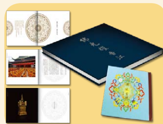
《佛光耀香江》佛頂骨舍利紀念冊 連 珍貴紀錄DVD (價值$180)+佛誕吉祥CD

電話：(852)2574 9371 電郵：magazine@hkbuddhist.org