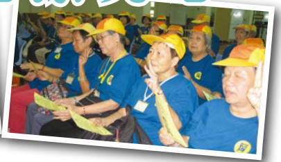
▲長者們進行簡單而意義深遠的宣誓儀式

友善、生動鬼馬的教授下，不時發出歡笑聲，加上口訣容易誦唱，學習不久，各長者學員不單很快掌握了十式操的要訣，更享受到做運動的樂趣。