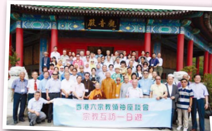
◀6月——六宗教互訪活動，今年由本會帶領各教友好訪寶蓮禪寺和觀音寺