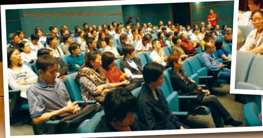
▲觀眾踴躍發問，分享感受。