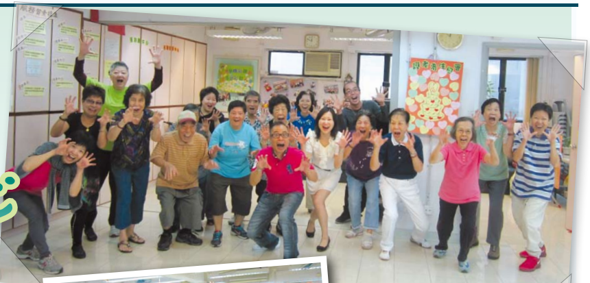
▲一班學員鬼馬大合照

歡笑瑜珈班深受長者歡迎，活動由導師分享開懷大笑之技巧。正所謂「一笑解千愁」，原來當中蘊藏不少科學理論，據知一分鐘的開懷大笑就等於十分鐘的慢跑，是既簡易又方便的帶氧運動；同時，大笑能令肺活量增大，鍛練橫隔膜和腹肌，促進血液輸送，使腸道通暢。此外，氧氣輸送大量增加，有助活化肌膚細胞，而且大笑能促使臉部肌肉運動，臉部自