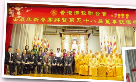
◀1月——本會新春團拜喜與各界同賀佳節

在得到社會人士廣大和積極的支持下，本會祈願新一年能開展更多利益眾生的服務，發揚佛陀的慈悲精神。☸